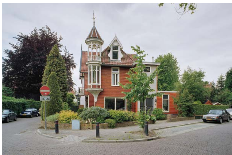
Sandtmannlaan 34 in Naarden. IJ.Th. Heins 2005